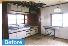
Before 築年数を感じさせる暗いLDKも、イメージ一新！追加した梁は、天井で隠し耐震性とデザイン性を両立。シャンデリア風の照明器具は、娘さんがネットで購入したもの