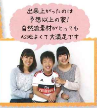
出来上がったのは予想以上の家！自然派素材がとっても心地よくて大満足です